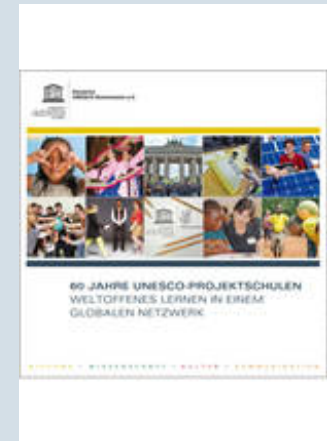
60 Jahre UNESCO-Projektschulen