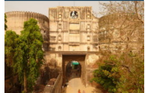
Altstadt von Ahmedabad