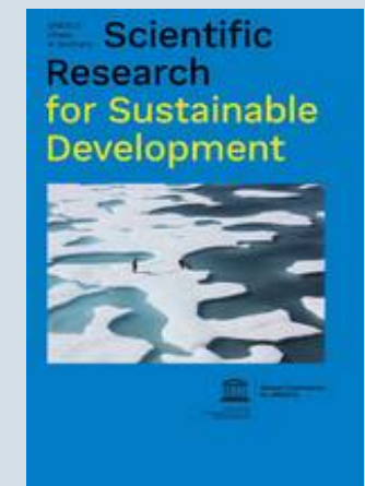
UNESCO Chairs in Germany