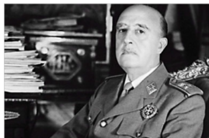
Il "generalissimo" Francisco Franco (1892-1972), che nel 1942 ordinò il cambio del fuso orario adottato dalla Spagna.

Tra i popoli europei abbondano i pregiudizi e le immagini stereotipate, affibbiati a ciascuno di essi dagli altri, che pretendono di inquadrare con una parola il "carattere" di un'intera nazione. Così, i tedeschi sono visti come "quadrati" nel modo di pensare, gli svizzeri sono precisi, i francesi sono accusati di essere presuntuosi, gli italiani sarebbero faciloni e così via. Tra le altre cose, gli spagnoli sarebbero degli inguaribili tiratardi, presentandosi agli appuntamenti ore dopo l'orario concordato e facendo tutto, dal lavoro ai pasti, con un ritardo di almeno un paio d'ore rispetto alla "tabella di marcia" dei loro vicini europei. Ebbene, per una volta questo stereotipo ha un fondo di verità: come ben sa chiunque sia stato in Spagna, gli spagnoli raramente cenano prima delle 21, indipendentemente dalla zona del Paese in cui ci si trova e dalla stagione, e in molti casi ci si mette a tavola anche più tardi, verso le 22. D'estate e nelle località di vacanza, poi, le 21-22 sono le ore dell'aperitivo, accompagnato dagli immancabili stuzzichini, le tapas , e non è raro che ci si trasferisca al ristorante per cena intorno alla mezzanotte... Anche gli orari dei negozi e degli uffici pubblici, o quelli dei palinsesti televisivi (la cosiddetta "prima