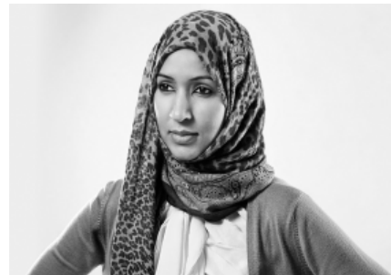
Manal al-Sharif, l'attivista per i diritti delle donne arrestata in Arabia Saudita nel 2011 per aver guidato l'automobile.

Il grande pubblico lo conosce soprattutto perché è uno degli uomini più ricchi del mondo, con un patrimonio personale stimato intorno ai 20 miliardi di dollari, ma Hassanal Bolkiah (il cui nome completo è Sultan Haji Hassanal Bolkiah Mu'izzaddin Waddaulah ibni Al-Marhum Sultan Haji Omar Ali Saifuddien Sa'adul Khairi Waddien!), è un sovrano inflessibile che governa con un potere quasi assoluto il sultanato del Brunei , piccolo Stato posto sulla costa settentrionale del Borneo, nell'Arcipelago Indonesiano. Grazie ai giacimenti di petrolio e gas naturale presenti sul suo territorio, il Brunei è diventato uno dei Paesi più ricchi dell'Asia, e la sua popolazione gode di un altissimo reddito pro capite, il quinto nella classifica mondiale.