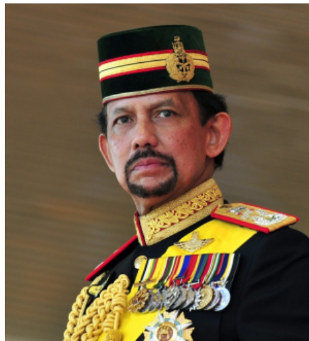
Il sultano del Brunei Hassanal Bolkiah.