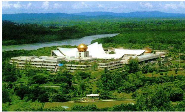
Il faraonico palazzo del sultano del Brunei, considerato la residenza privata più grande del mondo.

Conosciuta soprattutto, presso i non musulmani, per queste punizioni primitive da “occhio per occhio, dente per dente”, la Sharia è in realtà un sistema giuridico molto antico e complesso, fondato su due pilastri: le parole del Corano, il libro sacro dell'Islam, e gli insegnamenti morali fatti risalire alle parole del profeta Maometto e tramandati oralmente, che costituiscono la Sunnah . La Sharia non è solo un insieme di norme religiose, ma un codice che regola ogni aspetto della vita del fedele islamico, dalla vita personale (nascita, matrimonio, divorzio, eredità ecc.) a quella lavorativa, fino a regolare la vita pubblica e a stabilire ciò che costituisce reato e le relative punizioni. L'applicazione della Sharia è però molto complessa e soggetta a un'infinità di interpretazioni: non si tratta infatti di un corpus di leggi scritte e immutabili, ma di un sistema di norme basato sulla consuetudine e l'autorità degli studiosi di diritto islamico, gli ulema , che agiscono da giudici pronunciandosi sui singoli casi ad essi sottoposti.