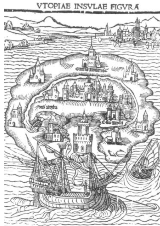
Incisione che raffigura la leggendaria isola di Utopia, pubblicata nell'omonimo volume del 1516.

interpretare sia come “non-luogo” sia come “buon-luogo”. Una distinzione che è rimasta anche nel linguaggio comune, dove “utopia” è passata a indicare un luogo o una condizione ideali, a cui si deve tendere, ma impossibili da realizzare nella realtà.