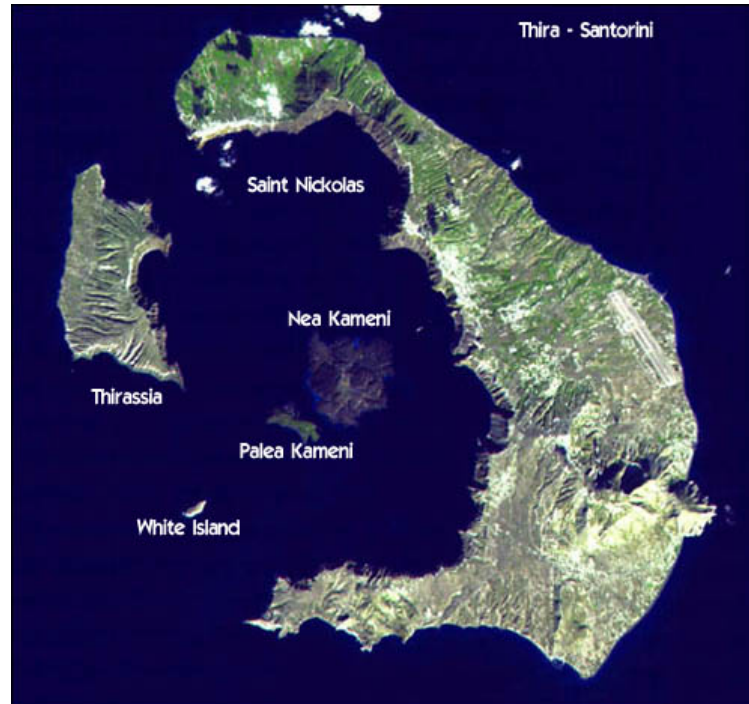
Immagine satellitare dell'isola di Santorini in Grecia. Il braccio di mare al centro è dove sorgeva il cratere dell'antica eruzione, sprofondato insieme a buona parte dell'originaria isola di Thera dopo la catastrofe.

“archeologia misteriosa”, quella di Atlantide sarebbe stata, come abbiamo già visto in uno scorso post , una civiltà incredibilmente avanzata dotata di macchine volanti e computer preistorici, e la catastrofe che la fece inabissare sarebbe stata causata nientemeno che da un’antica guerra nucleare! Alcuni ricercatori dichiarano di aver scoperto i resti sommersi di Atlantide al largo dell’atollo di Bimini, nelle Bahamas, dove si trova una formazione di rocce sommerse che, per la loro forma stranamente regolare, è stata identificata con le rovine di antiche strade o edifici.