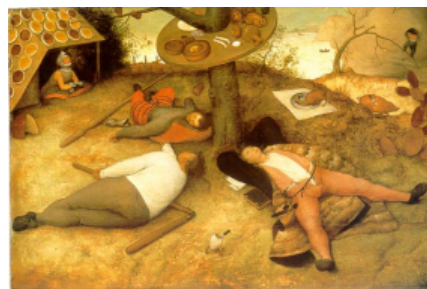
Il mitico paese di Cuccagna in un celebre dipinto di Pieter Bruegel il Vecchio (1563).

suo nome è usato ancora oggi nel linguaggio comune per indicare un luogo impossibile dove tutto va sempre per il verso giusto. Questo sito utilizza cookie tecnici e di profilazione di terze parti. Navigando nel sito accetti la nostra Privacy policy . dovizia e vivacità di particolari da farli sembrare quasi reali ai loro lettori. È il caso della fantastica Terra di Mezzo