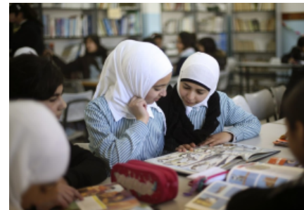
Ragazze palestinesi studiano su un libro di testo.

I libri di testo destinati alle scuole dovrebbero essere l'incarnazione dell'obiettività espositiva, comunicando agli allievi informazioni e conoscenze nel modo più imparziale possibile, e riflettendo il totale del sapere accumulato da una società e una cultura su un dato argomento. In realtà, come ben sanno i filosofi e gli esperti di comunicazione, è impossibile comunicare una qualsiasi informazione o conoscenza senza renderla soggetta, volontariamente o meno, a un'interpretazione, che riflette le opinioni o la cultura di chi produce il contenuto, oppure è dovuta alla struttura stessa e alle limitazioni del linguaggio usato per comunicare. Nel caso specifico dei libri di testo, queste interpretazioni sono spesso volte soltanto a semplificare e rendere più facile l'apprendimento di un concetto da parte degli studenti, ma in altre occasioni sono espressione di fenomeni molto più complessi, e mettono a nudo dibattiti e contrapposizioni scientifiche, culturali e politiche che hanno diviso persone, Stati e culture per decenni o addirittura secoli. Pensiamo al dibattito sull' insegnamento della teoria dell'evoluzione di Darwin nelle scuole statunitensi, che porta regolarmente nelle aule di tribunale e nelle stanze della politica americana questioni che attengono alla sfera della