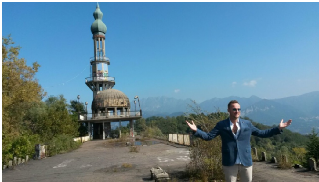
Il cantante Francesco Facchinetti durante il "sopralluogo" effettuato a Consonno, in compagnia di alcuni potenziali investitori, il 25 settembre.

Ma non tutto è perduto. L'annuncio di vendita ha infatti innescato una polemica tra l'architetto che l'ha pubblicato e una società immobiliare che si dichiara la sola rappresentante dei proprietari di Consonno, la quale ha seccamente smentito che il borgo sia stato messo in vendita. L'architetto da parte sua ha confermato la veridicità dell'annuncio, dichiarando che alcune società immobiliari estere si sono già interessate all'acquisto. Ma a comprare Consonno si dice intenzionato anche un personaggio del mondo dello spettacolo: Francesco Facchinetti, in arte Dj Francesco. Il cantante ha infatti lanciato sul proprio sito e sui social network un appello alla grandi aziende italiane per formare una cordata di investitori, rilevare la proprietà del borgo abbandonato e trasformarlo in un polo tecnologico e di ricerca, una "città dei giovani" analoga a un campus universitario americano, con aule, laboratori ed edifici residenziali. I giornalisti, con il loro amore per le frasi fatte, hanno già ribattezzato Consonno, da "Las Vegas della Brianza", "Silicon Valley lombarda". Sembra che le intenzioni del giovane figlio d'arte siano serie: nei giorni scorsi ha incontrato il presidente della Regione Lombardia e il sindaco di Olginate (comune di cui Consonno è frazione) per esporre il suo progetto, e si è recato di persona sul posto per effettuare un sopralluogo .