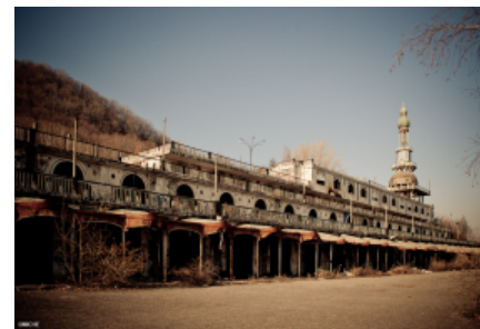
Una veduta del borgo di Consonno in provincia di Lecco, tra i più noti "paesi fantasma" d'Italia.