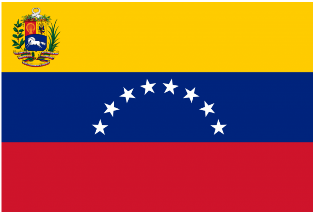
L'attuale bandiera del Venezuela, con l'ottava stella aggiunta nel 2006.