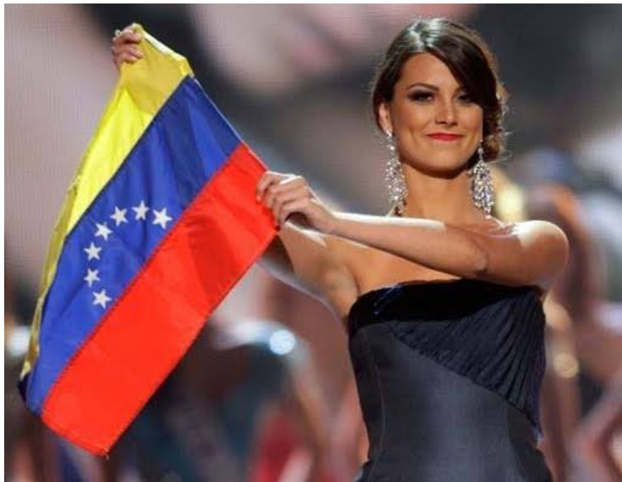
La modella venezuelana Stefania Fernández sfila con la “vecchia” bandiera del Venezuela, con sette stelle, alla finale di Miss Universo nell’agosto 2010.

L’uso della vecchia bandiera con sette stelle come segno di opposizione nei confronti di Chavez e Maduro non è d’altra parte recente. Già nel 2010 aveva fatto notizia il gesto di Stefania Fernández , modella e conduttrice televisiva venezuelana, nonché vincitrice dell’edizione 2009 del concorso di bellezza Miss Universo. Nel corso della finale per l’edizione 2010 del premio, tenutasi a Las Vegas, Fernández, che era la Miss uscente ed era intervenuta per cedere lo scettro e la corona alla nuova vincitrice, aveva sfilato sul palco sventolando una bandiera venezuelana con sette stelle, in aperto segno di contestazione verso il governo venezuelano allora in carica.