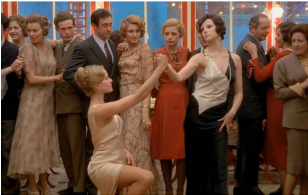
Una scena da "Il conformista", regia di Bernardo Bertolucci

Nei primi anni Settanta, però, Pier Paolo Pasolini parla di un "nuovo fascismo" che ha prodotto (stava producendo in quegli anni, e le cose non sono certo migliorate da allora) nuovi conformismi. È il "Potere" (con l'iniziale maiuscola, come Pasolini scrive sempre questa parola negli Scritti corsari ) della società dei consumi, basato su una ideologia la quale pretende di insegnare che possiamo essere tanto più felici quanto più siamo in grado di acquistare e consumare beni materiali. Per Pasolini è, questa, l'apoteosi della mentalità borghese, l'affermazione ormai illimitata di una sorta di "borghesizzazione" dell'intera società, comprese le classi popolari: come si capirà, per lo scrittore friulano la borghesia non è semplicemente una classe sociale, ma una condizione dello spirito.