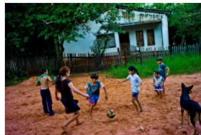
Bambini giocano oggi a Nueva Germania.

L'"utopia ariana" di Förster, però, dovette ben presto scontrarsi con la dura realtà del luogo scelto per il paradisiaco insediamento: i cattivi raccolti, le malattie e, non da ultimo, la megalomania dello stesso Förster, che governava la comunità con il pugno di ferro, portarono in poco tempo i coloni alla fame. Vedendo il suo sogno fallire così miseramente, Förster si suicidò appena due anni dopo, nel 1889, e la moglie Elisabeth tornò in Germania nel 1893. Diverse famiglie di coloni decisero però di restare, e per sopravvivere dovettero necessariamente mettere da parte ogni forma di razzismo, mescolandosi alla popolazione locale e imparando da essi a vivere in una terra così diversa dalla loro.