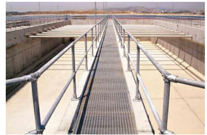
Barierki na oczyszczalni ścieków - złącza Kee Klamp