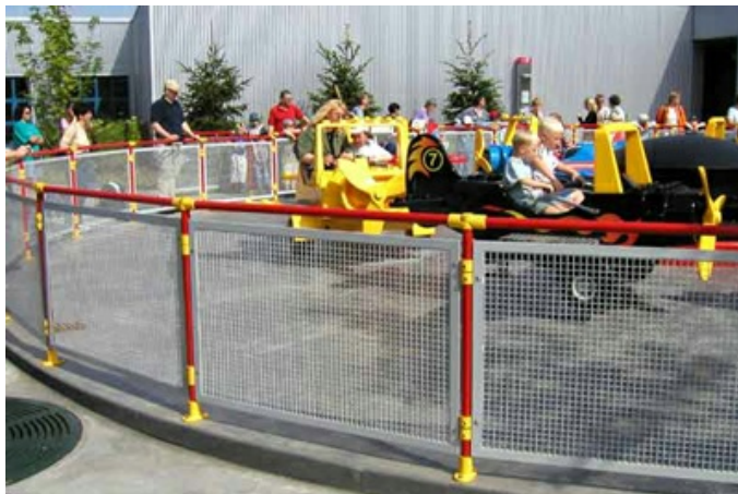
Barierki na placu zabaw - Kee Klamp