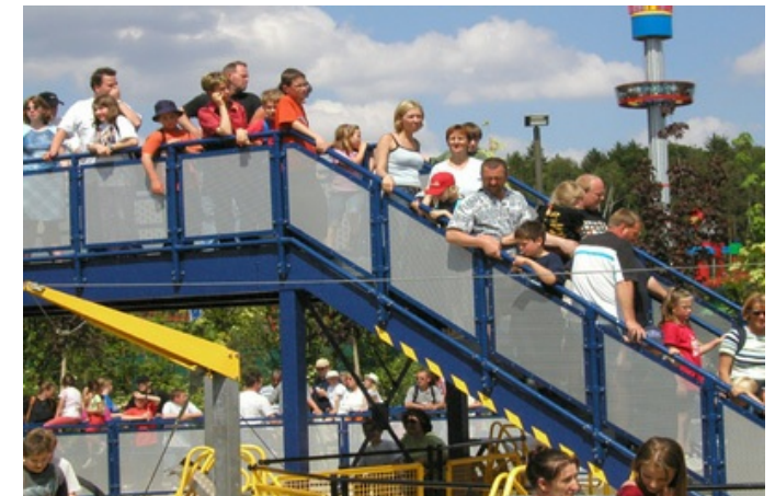
Barierki na placu zabaw - Kee Klamp