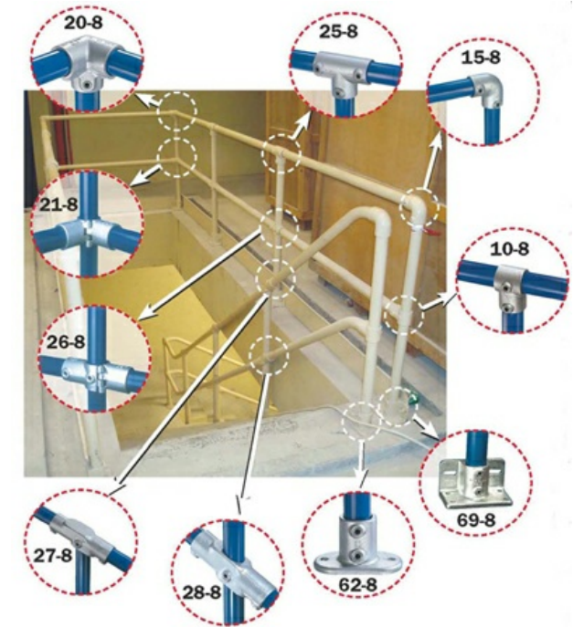
Barierki na schodach - złącza Kee Klamp