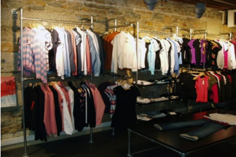
Konstrukcje rurowe pod wieszaki - Kee Klamp

Złącza KEE KLAMP pomagają w kreacji nowoczesnych wnętrz sklepów.