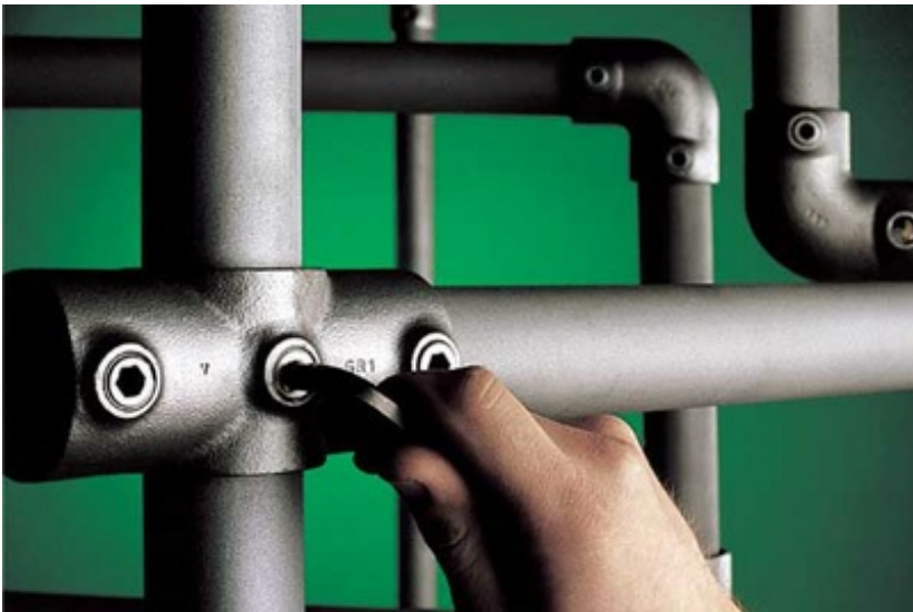
Żeliwne złącza Kee Klamp do połączeń rurowych

Złącza rurowe Kee Klamp to tańsza i szybsza alternatywa dla tradycyjnie spawanych barierki ochronnych. Komponenty rurowe Kee Klamp bezpiecznie łączą standardowe rozmiary rur ze stali konstrukcyjnej w niemal każdym układzie jaki można sobie wyobrazić, wykorzystując najszerszą gamę złączek rurowych obecnych na rynku. Konstrukcja poręczy i barierki ochronnych jest niezwykle prosta i nie wymaga gwintowania, wiercenia ani spawania - wystarczy zwykły klucz szesciokatny do montażu bezpiecznego i stabilnego połączenia. Konstrukcje wykonane przy użyciu złączek Kee Klamp pozwalają zaoszczędzić na materiałach, czasie i kosztach robocizny.