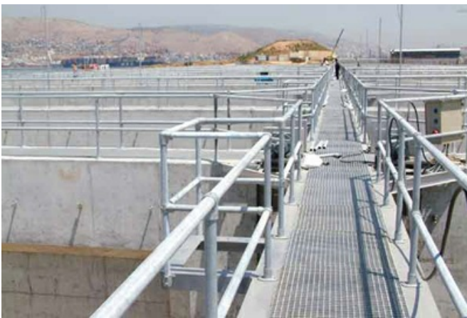
Barierki na oczyszczalni ścieków - złącza Kee Klamp