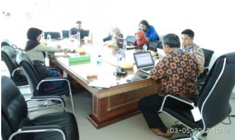
Sedang Asik mengirim Jurnal Untuk Bagian Materi Author (penulis)