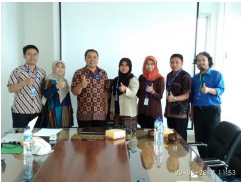
Berfoto Bersama setelah acara Selesai, dengan suasana menyenangkan ...

Cukup 2 Jam Saja, Untuk Meng-Onlinekan Satu Volumen Penerbitan Jurnal Online dengan Memanfaatkan OJS, Hasil Akhir setelah pelatihan ini Jurnal "Appolo" Sudah Online