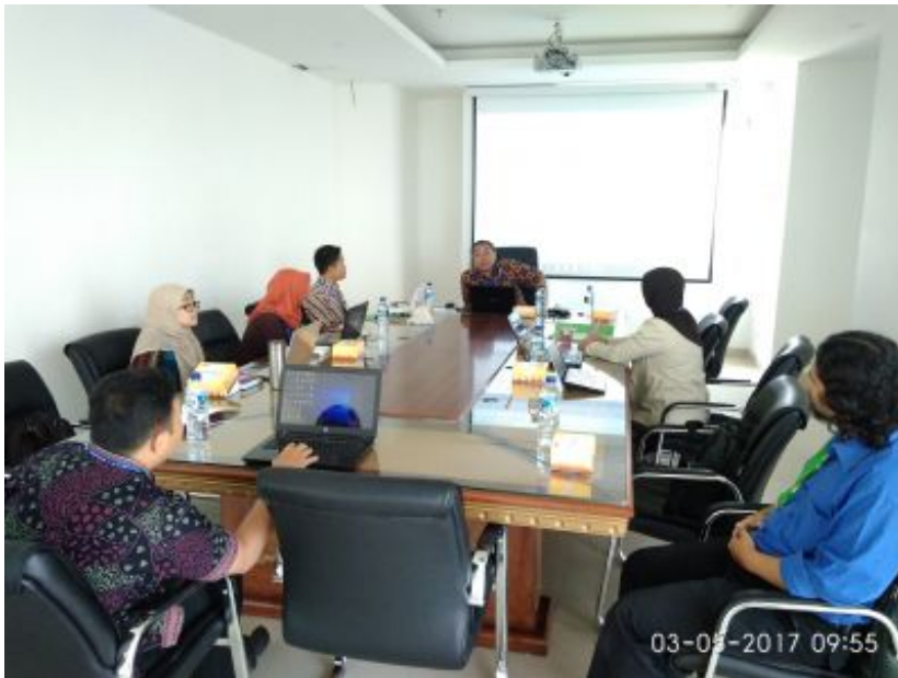
Suasana tempat Pelatihan