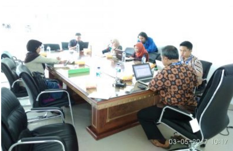
Sedang Asik mengirim Jurnal Untuk Bagian Materi Author (penulis)