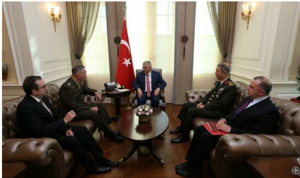
Ο Τούρκος πρωθυπουργός Μπιναλί Γιλντιρίμ στη συνάντησή του με τον Αμερικανό Αρχηγό ΓΕΕΘΑ Τζόζεφ Ντάνφορντ Τζ.

Κι αυτό, γιατί φαίνεται ότι η Τουρκία του Ερντογάν είναι έτοιμη να κηρύξει τον πόλεμο εναντίον εσωτερικών και εξωτερικών εχθρών, για κάθε λόγο που η ίδια θεωρεί ότι αντιστρατεύεται τα συμφέροντά της. Επίσης, έχει και γεωπολιτικό ενδιαφέρον, γιατί η Τουρκία θεωρεί ότι διέβη τον δικό της Ρουβικώνα και είναι έτοιμη να επανακαθορίσει ακόμα και να συγκρουστεί με τις ΗΠΑ, το NATO και την ΕΕ και να διεκδικήσει θέση υπερδύναμης, με ό,τι αυτό σημαίνει για την ασφάλεια και τη σταθερότητα στην περιοχή. Όσον αφορά την ουσία της πολιτικής αντίληψης από την οποία διαπνέεται το άρθρο, αυτή είναι καθαρά μεσσιανική και μας επιτρέπει να πούμε ότι έχει στοιχεία ταλιμπανισμού, κάτι που πρέπει να τύχει ιδιαίτερης προσοχής και ανάλυσης από όλους εκείνους που επηρεάζονται από τις πολιτικές της Τουρκίας.