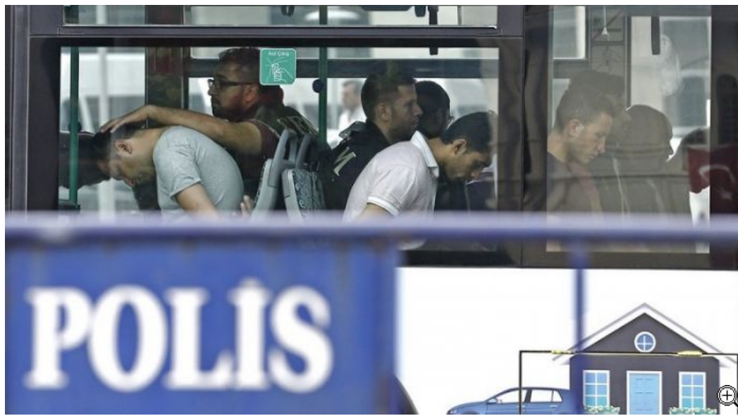
Συλληφθέντες στρατιώτες χωρίς τη στρατιωτική περιβολή...

Η Τουρκία έχει αποκτήσει αυτήν την ευκαιρία, μετά το καταστροφικό πραξικόπημα. Αυτή την ευκαιρία πρέπει να την εκμεταλλευτούμε. Δεν αρκεί να διορθώσουμε τα κακώς κείμενα, αλλά θα πρέπει να βάλουμε τα θεμέλια ενός νέου συστήματος, να ενισχύσουμε τους κοινωνικούς δεσμούς και να προετοιμαστούμε να αντιμετωπίσουμε ακόμα μεγαλύτερες φουρτούνες.