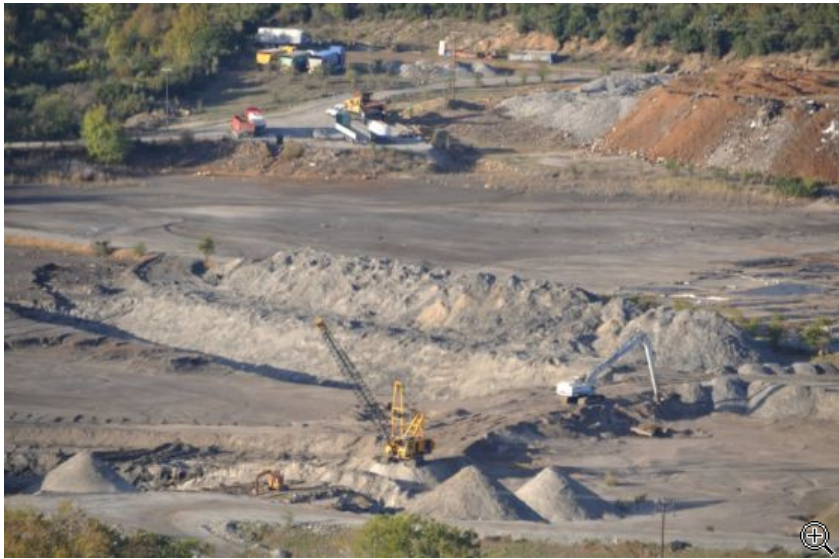
Φωτογραφία: η χρυσοφόρα «χαβούζα» της Ολυμπιάδας

Να ενημερώσουμε τον κ. Δεβελέγκο ότι η Eldorado Gold δεν παράγει χρυσό. Όχι στην Ελλάδα τουλάχιστον. Οι payable gold ounces που αναφέρονται στα οικονομικά αποτελέσματα τριμήνου της Eldorado Gold είναι χρυσός της Ολυμπιάδας που παράγεται σε κάποιο εργοστάσιο μεταλλουργίας στην Κίνα. Αυτό που παράγεται στην Ολυμπιάδα είναι ΣΥΜΠΥΚΝΩΜΑ χρυσοφόρου αρσενοπυρίτη , από την επεξεργασία των μεταλλευτικών αποβλήτων που έχουν απομείνει στον κάμπο της Ολυμπιάδας από την εποχή της Α.Ε.Χ.Π.&Λ.