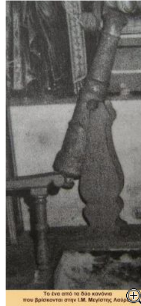
Το ένα από τα δύο κανόνια που βρίσκονται στην Ι.Μ. Μεγίστης Λαύρας