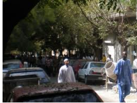
Η πλατεία Κολιάτσου όπως είναι σήμερα

Κολιάτσος Στυλιανός (+ 1878) : Στρατιωτικός και πολιτικός που έδρασε στο γ' τέταρτο του 19ου αιώνα. Η οικογένεια Κολιάτσου είχε κτήματα στην περιοχή που είναι σήμερα η πλατεία και η ομώνυμη συνοικία. Ο Στυλιανός Κολιάτσος ήταν αξιωματικός της χωροφυλακής επί Όθωνος και εκλέχτηκε πληρεξούσιος στη Β' Εθνοσυνέλευση ( 1864 ) και πολλές φορές βουλευτής. Έπαιξε επίσης σημαντικό ρόλο στις συζητήσεις για το Σύνταγμα της χώρας. Διετέλεσε Δημοτικός Σύμβουλος Αθηναίων από το 1866 έως το 1878 και Πρόεδρος του Δημοτικού Συμβουλίου (1866-1874). Βρίσκεται μεταξύ των οδών Πατησίων, Καλλινίκου και Σίφνου .