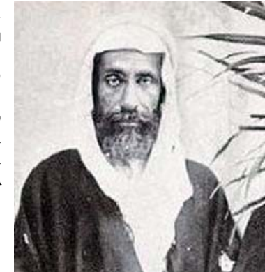
Muhammad ibn Abd al-Wahhab

Οι Σαούντ καθιέρωσαν τον Ουαχαμπισμό ως επίσημη θρησκεία του κράτους του νέου Βασιλείου της Σαουδικής Αραβίας και, όπως και οι κεμαλιστές στην Τουρκία, άρχισαν να κινούνται ενάντια σε άλλες ισλαμικές πεποιθήσεις και δόγματα, συμπεριλαμβανομένων των Σουνιτών και Σιιτών. Και τώρα, ας συνοψίσουμε τα αναπόφευκτα συμπεράσματα που βγαίνουν από όσα προαναφέραμε: