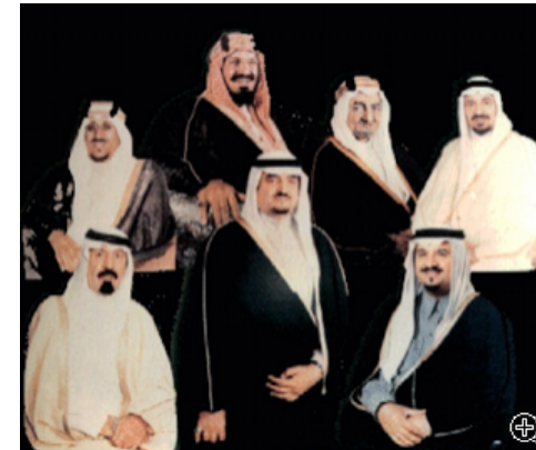
ο βασιλικός οίκος Saudi

Οι Σαούντ καθιέρωσαν τον Ουαχαμπισμό ως επίσημη θρησκεία του κράτους του νέου Βασιλείου της Σαουδικής Αραβίας και, όπως και οι κεμαλιστές στην Τουρκία, άρχισαν να κινούνται ενάντια σε άλλες ισλαμικές πεποιθήσεις και δόγματα, συμπεριλαμβανομένων των Σουνιτών και Σιιτών. Και τώρα, ας συνοψίσουμε τα αναπόφευκτα συμπεράσματα που βγαίνουν από όσα προαναφέραμε: