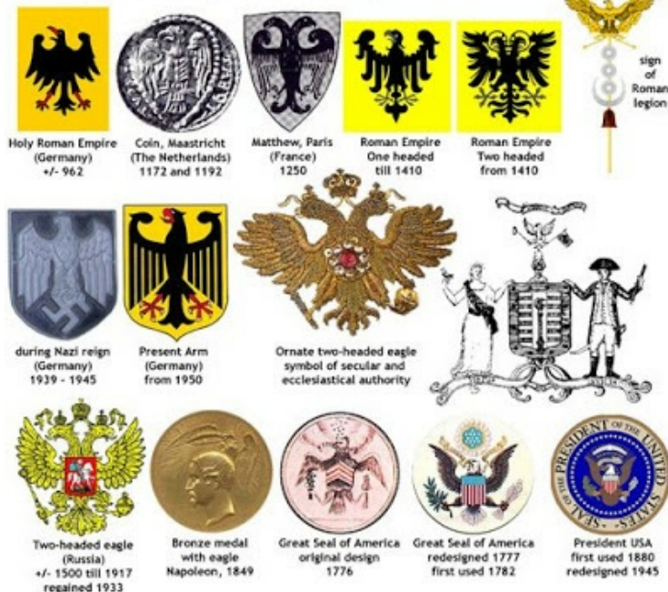
The Eagle / Seal (divide & unite)

Επίσης ο "αετός" ΕΙΝΑΙ .... το σύμβολο HOLY ROMAN EMPIRE... ( ορα τον πρώτο δεξιά της φωτο με τους αετούς) της Γερμανικής Αυτοκρατορίας.