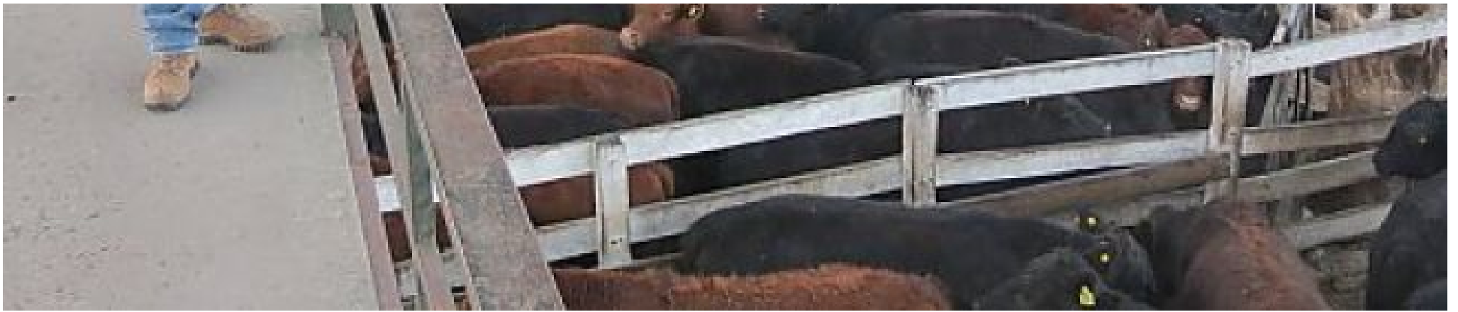
Mercado de Liniers (Argentina)