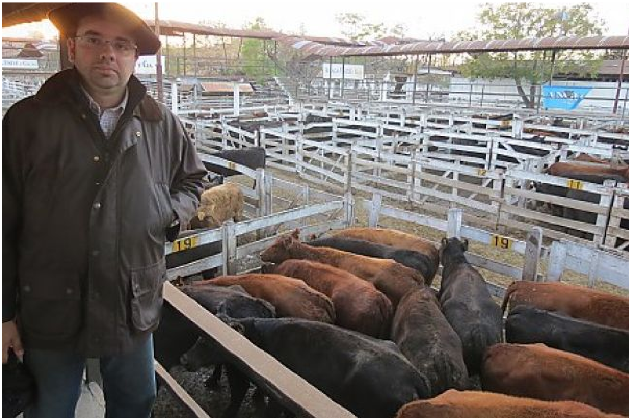
Mercado de Liniers (Argentina)