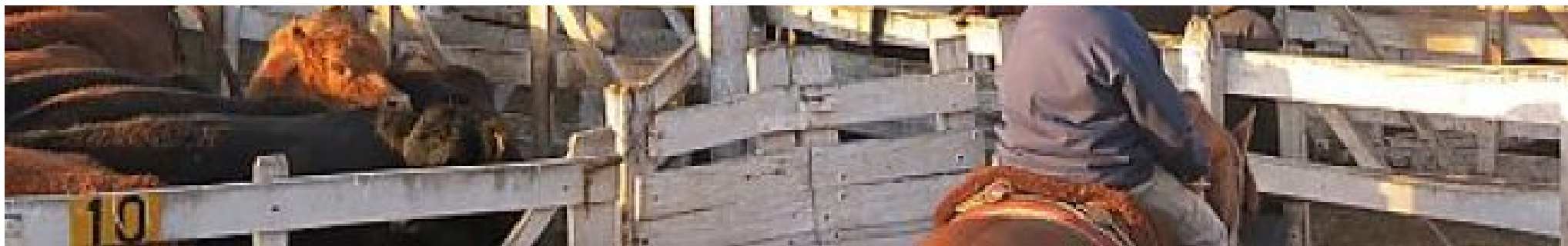
Mercado de Liniers (Argentina)