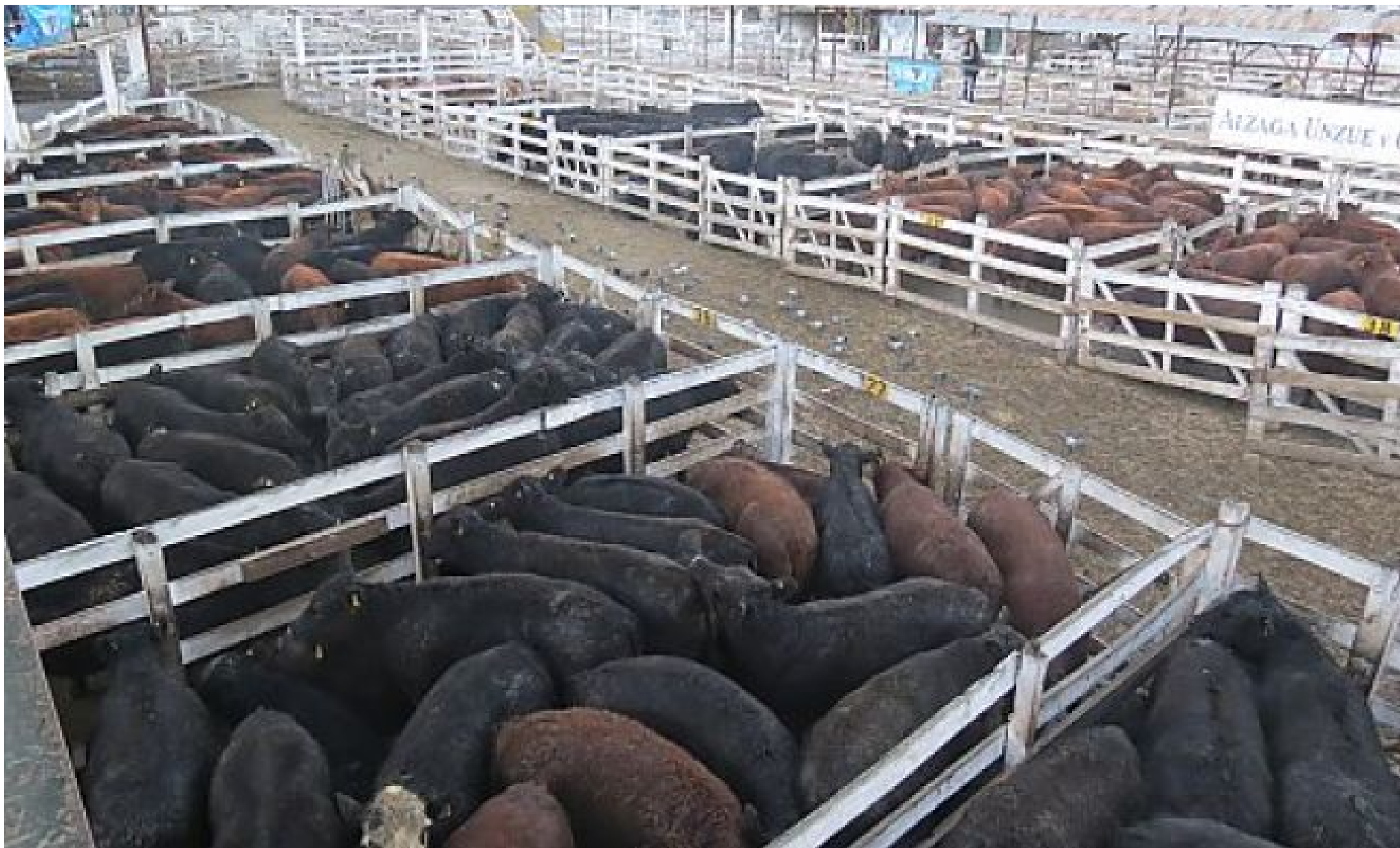
Mercado de Liniers (Argentina)