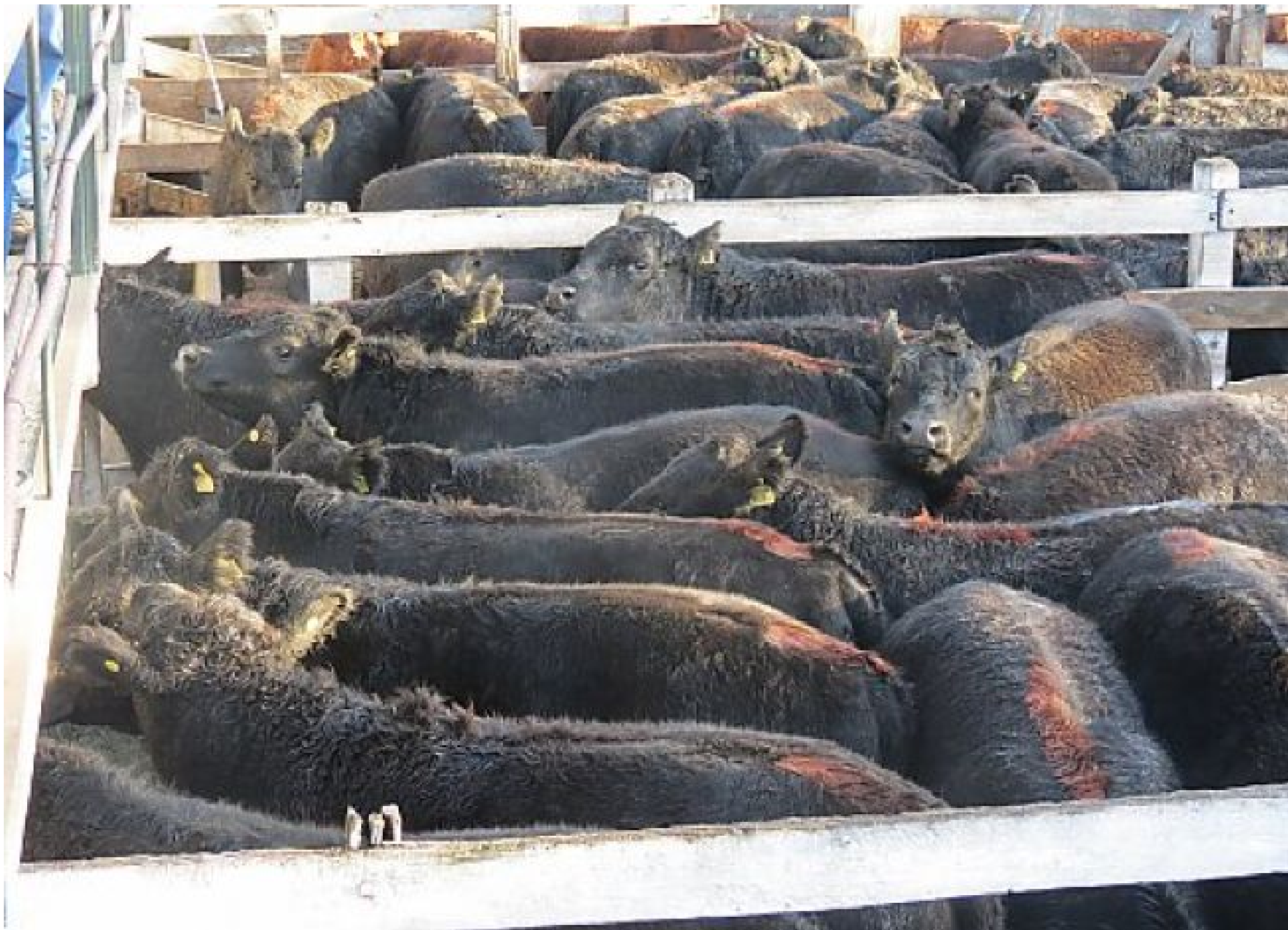
Mercado de Liniers (Argentina)