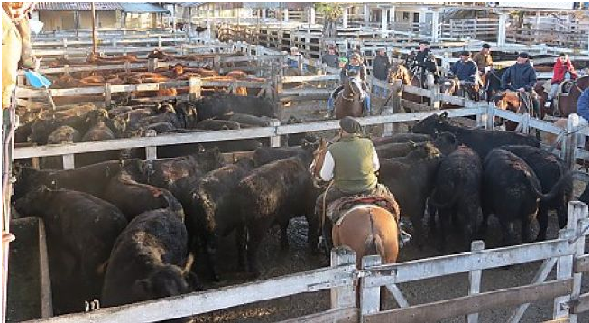
Mercado de Liniers (Argentina)