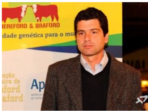
Hereford, a todo vapor (por Ricardo Furtado)