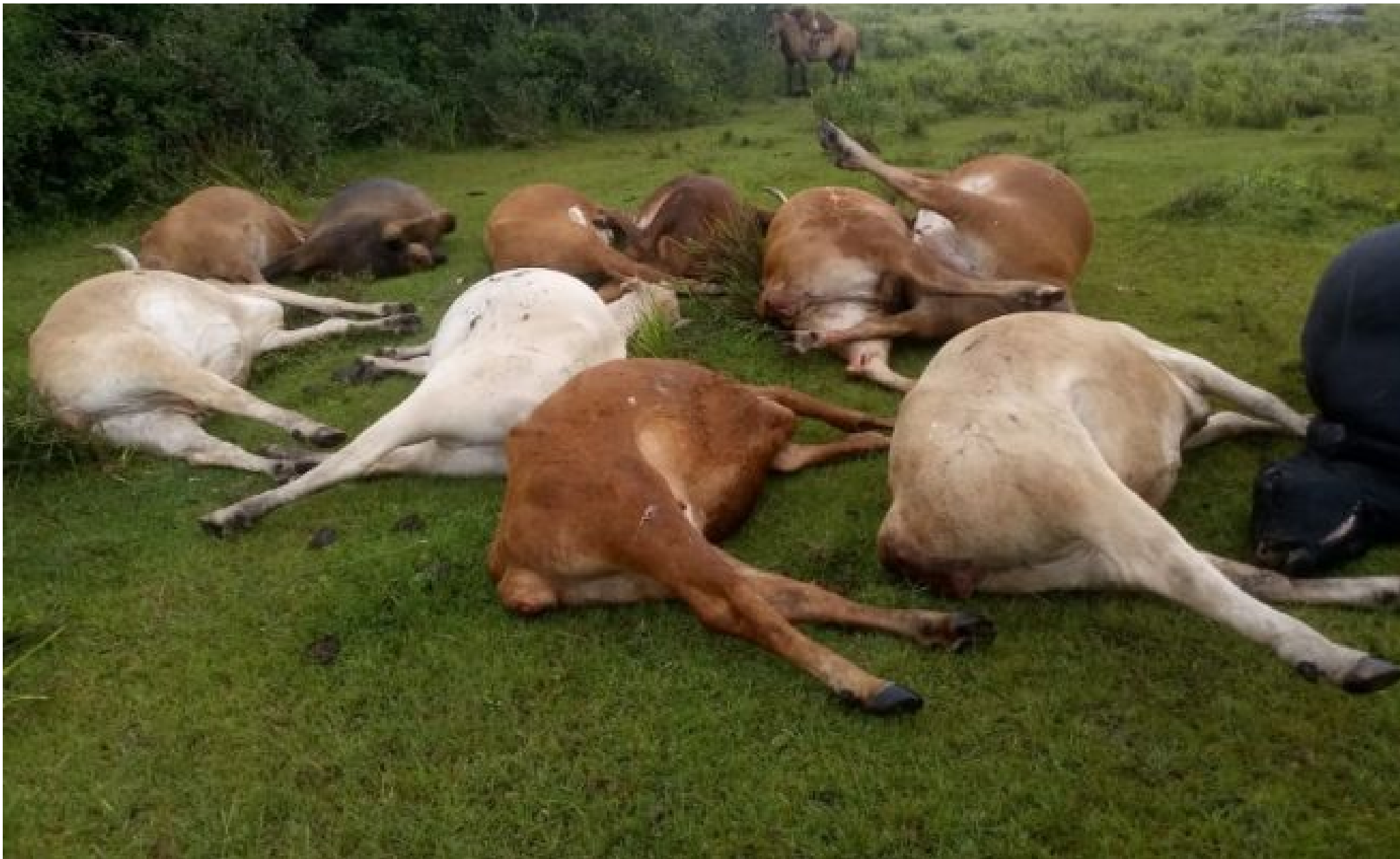
Vacas morrem envenenadas em propriedade rural em Santana da Boa Vista