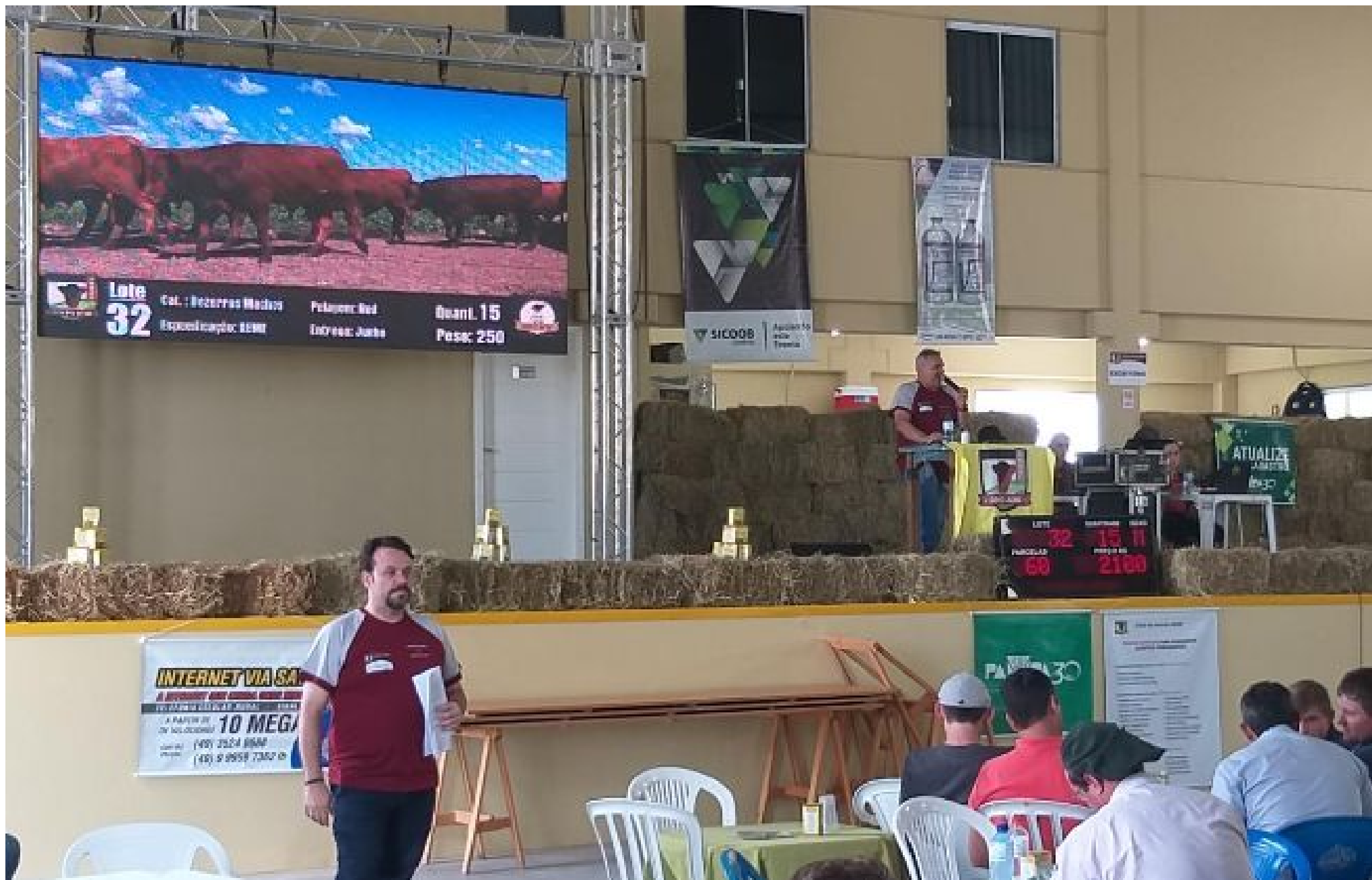
3º Dia do Parceiro: Grupo AEME supera R$ 8,00 para terneiros e avança no modelo Venda Futura