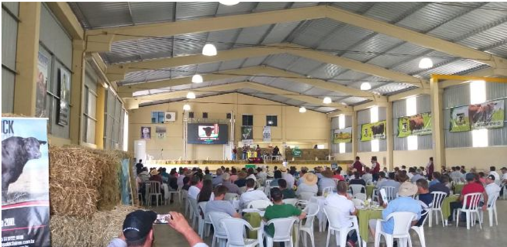
3º Dia do Parceiro: Grupo AEME supera R$ 8,00 para terneiros e avança no modelo Venda Futura