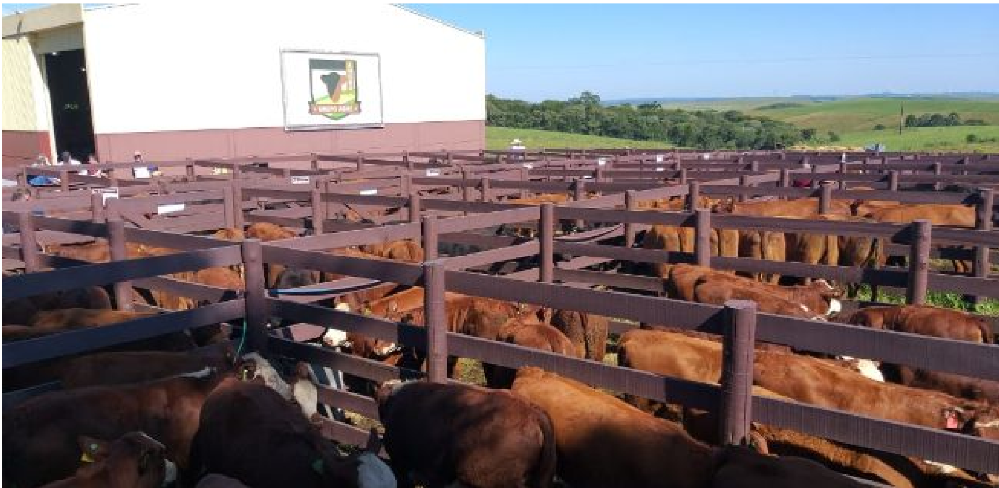
3º Dia do Parceiro: Grupo AEME supera R$ 8,00 para terneiros e avança no modelo Venda Futura