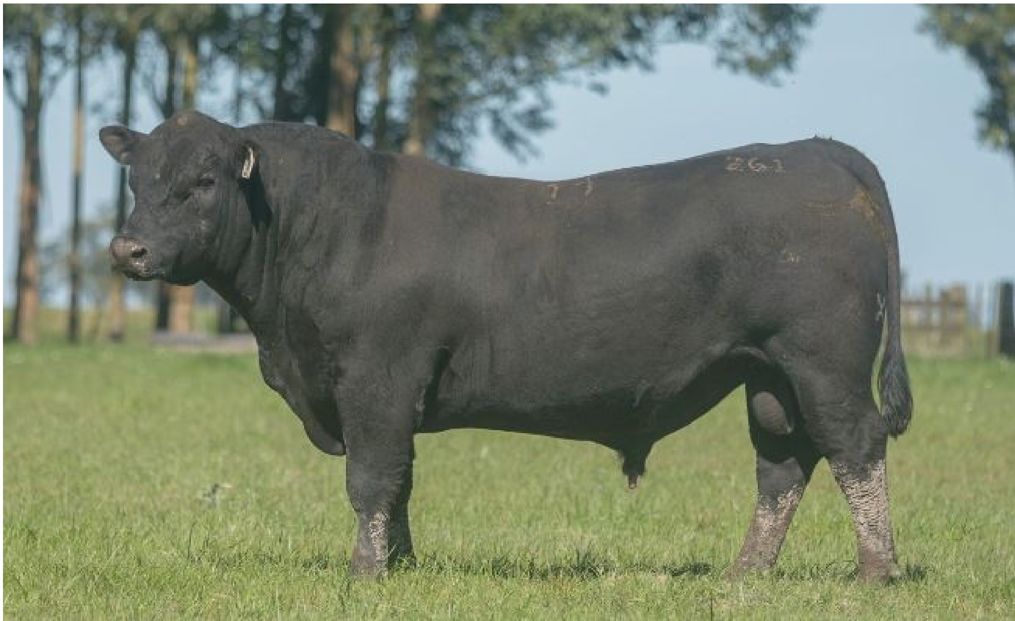
Reserva Angus tem pista limpa e média de R$ 11,3 mil por touro