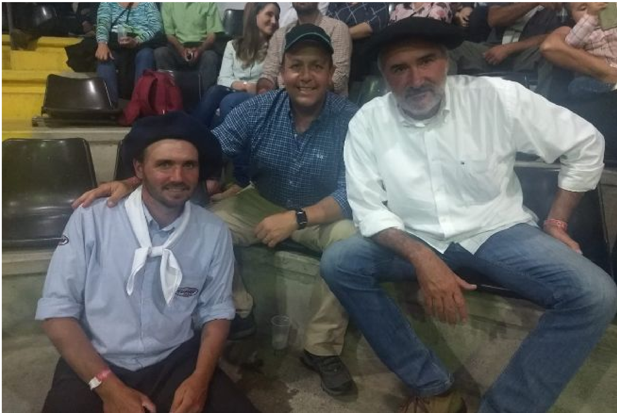
Reserva Angus tem pista limpa e média de R$ 11,3 mil por touro