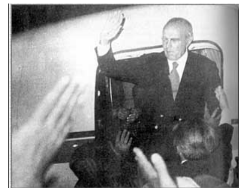
Η επιστροφή του "εθνάρχη", Ιούλιος '74

http://antipliroforisi.blogspot.gr/2012/08/blog-post_13.html