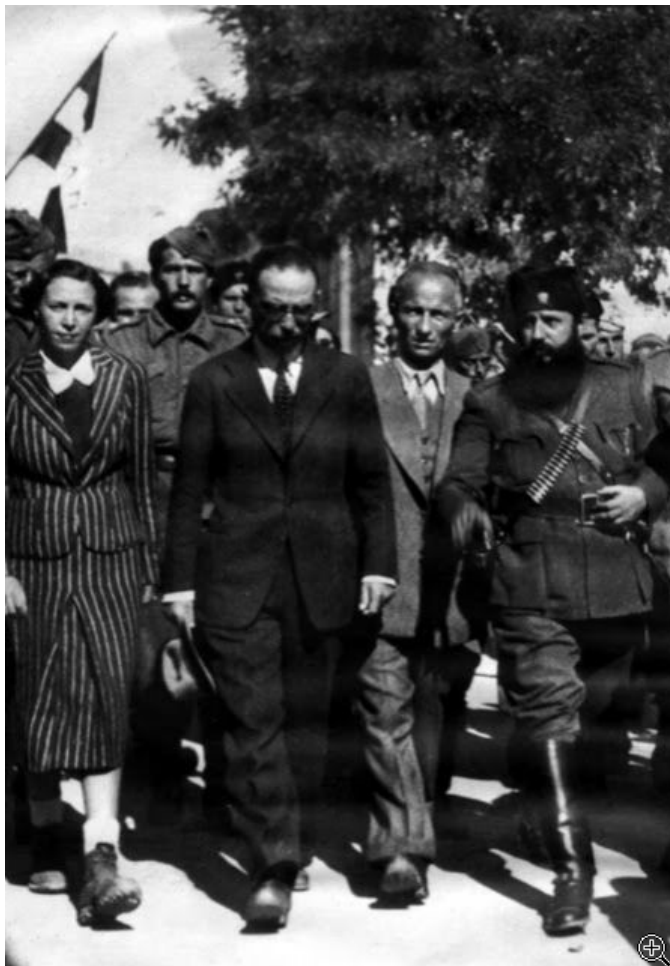
Ο Γεώργιος Σημίτης με τον Άρη Βελουχιώτη στους δρόμους της Λαμίας.