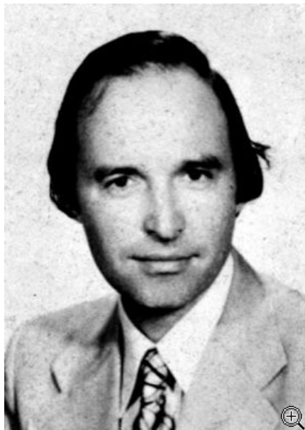
Ο Κώστας Σημίτης στα πρώτα χρόνια της πολιτικής σταδιοδρομίας του.

Από το βιβλίο «Οι Δωσίλογοι της κατοχής», Ιάκωβου Χονδροματίδη, έκδοση του περιοδικού ΙΣΤΟΡΙΚΑ ΘΕΜΑΤΑ