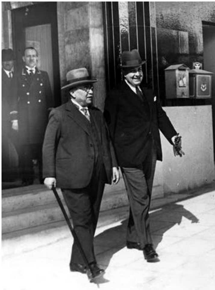
Ο Ιωάννης Μεταξάς, συνοδευόμενος από τον Θεολόγο Νικολούδη. Ο πατέρας Σημίτης έτρεφε βαθύ θαυμασμό για τον δικτάτορα της 4ης Αυγούστου.