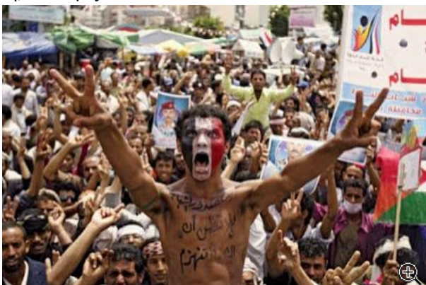
Μια «χρωματιστή επανάσταση» από την Μέση Ανατολή σε λίγο στην καρδιά της Ευρώπης

Δεν είναι το θέμα αν θα βοηθήσουμε τους πρόσφυγες ή όχι. Κάθε σκεπτόμενο άτομο γνωρίζει ότι χρειάζεται να βοηθήσει ανθρώπους που βρίσκονται σε ανάγκη. Αυτό που συμβαίνει στην Ευρώπη δεν αφορά τη βοήθεια προς τους πρόσφυγες, αλλά την εγκαθίδρυση μιας «χρωματιστής επανάστασης» στην Ευρώπη από τους πρόσφυγες . Αυτό θα οδηγήσει σε διεύρυνση των συγκρούσεων, της τρομοκρατίας και της αποσταθεροποίησης στην Ευρώπη.