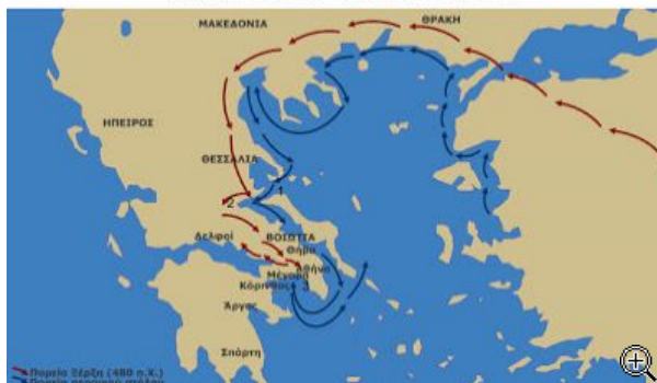
εκστρατεία του Ξέρξη

Ο ελληνικός στρατός άρχισε να φτάσει στην Ελευσίνα διότι οι Λακεδαιμόνιοι αναγκάστηκαν να περιμένουν τους άλλους Πελοποννήσιους. Προσήλθαν τελικά 1500 Τεγέατες, 5000 Κορίνθιοι, 300 Ποτιδιαίτες άποικοι των Κορινθίων, 600 Ορχομένιοι Αρκάδες, 3000 Σικυώνιοι, 800 Επιδαύριοι, 1000 Τροιζήνιοι, 200 Λεπρέατες, 400 Μυκηναίοι και Τυρύνθιοι, 1000 Φλιάσιοι, 300 Ερμιονείς, 600 Ερετριείς και Στυρείς, 400 Χαλκιδείς, 500 Αμβρακιώτες, 800 Λευκάδιοι, 200 Παλλείς από την Κεφαλληνία και 500 Αιγινίτες. Όταν ο στρατός έφτασε στα Μέγαρα ενώθηκε με 8000 Αθηναίους και 600 Πλαταιείς με αρχηγό τον Αριστείδη. Στις δυνάμεις αυτές αν προστεθούν και οι 5000 Σπαρτιάτες που ακολουθούνταν από 3500 ειλώτες και 1800 Θεσπιείς, ο Ελληνικός στρατός αριθμούσε 11000 άνδρες. Από την Ελευσίνα ο Πausανίας περνώντας στη Βοιωτία είδε τον περσικό στρατό να έχει παραταχθεί στον Ασωπό ποταμό και μη τολμώντας να κατέβει στην πεδιάδα ώστε να αντιπαρατεθεί με τους 300.000 άνδρες του περσικού στρατού, προτίμησε να στρατοπεδεύσει στους πρόποδες του βουνού.