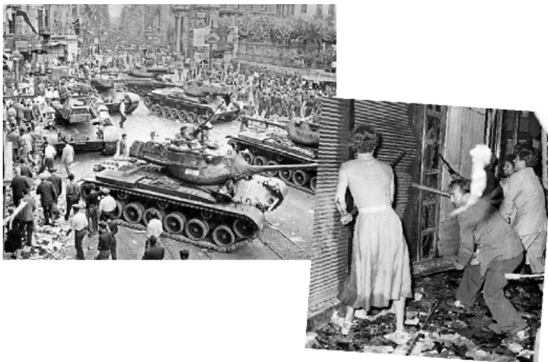
Οι μειονότητες αντιλήφθηκαν μήπως το τι τις περίμενε;

Εκείνο που εκπλήσσει είναι η μυστικότητα με την οποία εξελίσσονται τα πράγματα δίχως κανείς να τα αντιληφθεί. Παρ' όλα αυτά το πιθανότερο είναι οι επικεφαλής του Δημοκρατικού Κόμματος να μην είχαν ιδέα για την έκταση που θα δίδονταν στα γεγονότα. Δεν ήταν δυνατό να δώσουν άδεια, καθότι τις μέρες εκείνες υπήρχε στην Πόλη σε εξέλιξη μια σημαντική διεθνής συνάντηση. Δεν νομίζω ότι μια κυβέρνηση θα τολμούσε κάτι τέτοιο. Όμως στη διοργάνωση υπάρχει δάκτυλος πολλών κέντρων. Κέντρα που επεξεργάζονταν την αποδυνάμωση της οικονομικής ισχύς των μειονοτήτων και την εκδίωξή τους. Τα κέντρα αυτά έδωσαν αυτή την έκταση.