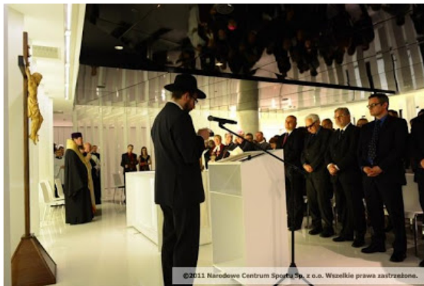
© 2011 Narodowe Centrum Sportu Sp. z o.o. Wszelkie prawa zastrzeżone.