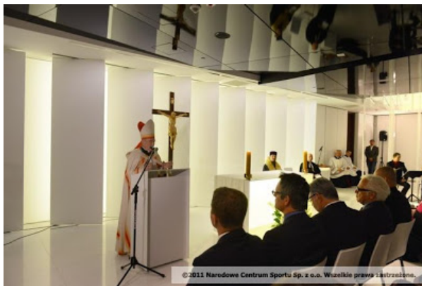
© 2011 Narodowe Centrum Sportu Sp. z o.o. Wszelkie prawa zastrzeżone.