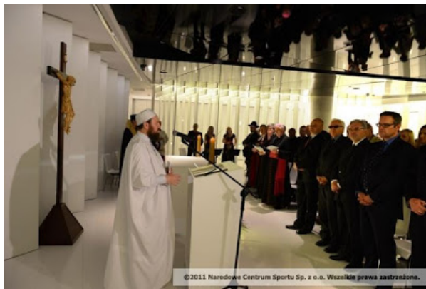
© 2011 Narodowe Centrum Sportu Sp. z o.o. Wszelkie prawa zastrzeżone.