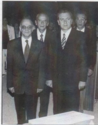
Ο Δήμαρχος Αθηναίων και εκπρόσωποι της ηγεσίας του Εβραϊσμού της Ελλάδος, κατά την τελετή.