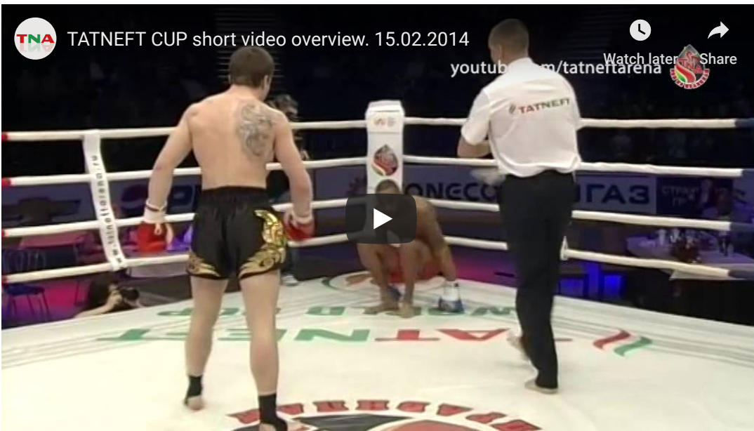
Полное видео Чемпионата мира «Бои по правилам TNA на кубок TATNEFT» сезона 2013-2014 от 15 февраля 2014 года. 1/8 Финала (видео без звука):