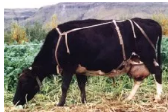
Móðir : Ljúf 0275