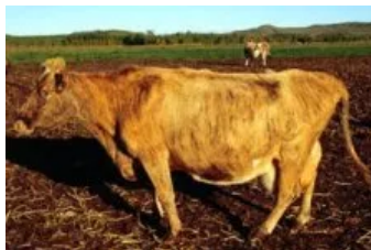
Móðir : Blanda 0229