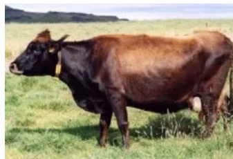
Móðir : Grýla 0015