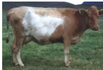
Móðir : Blika 0171