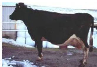
Móðir : Skrá 0267