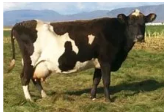
Móðir : Gjörð 0156