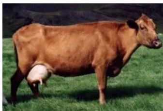
Móðir : Fluga 0254