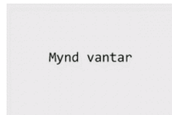
Móðir : Bjalla 0166