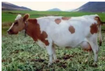
Móðir : Rós 0404