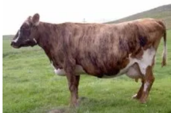
Móðir : Doppulína 0221