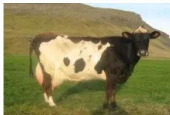
Móðir : Skrauta 0192