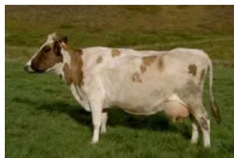
Móðir : Stáss 0319