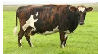
Móðir : Gústa 0643