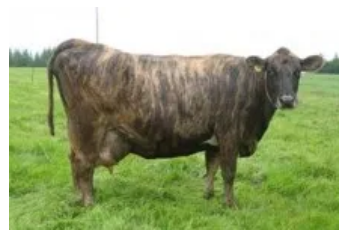
Móðir : Slóð 0692