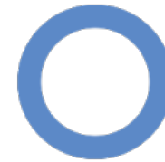
डायबिटीज़ का चिन्ह