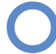
डायबिटीज़ का चिन्ह