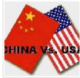
நவீன மகா யுத்தம்