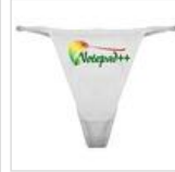
படம் வரைந்து புரோகிராம்களை எழுது