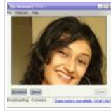
போலி வெப்கேமும் சில சுட்டிகளும்