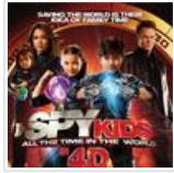
3டி to 4டி