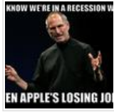
வி வில் மில்ஸ் யூஸ்