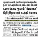
பணம் கொத்திப் பறவைகள்