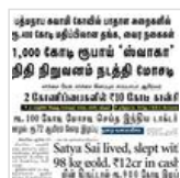
பணம் கொத்திப் பறவைகள்