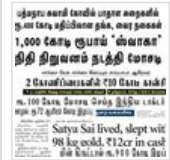
பணம் கொத்திப் பறவைகள்