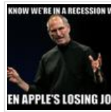
வி வில் மிஸ் யூ ஸ்டீவ்