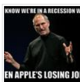
வி வில் மிஸ் யூ ஸ்டீவ்