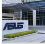
எங்கே தான் தவறு