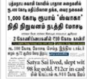
பணம் கொத்திப் பறவைகள்