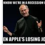
வி வில் மிஸ் யூ ஸ்மீவ்