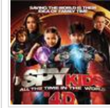
3டி to 4டி